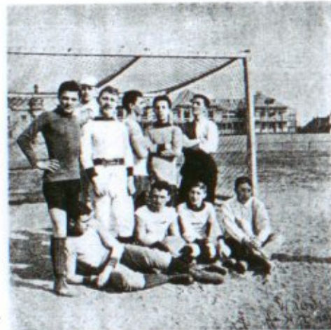
A Magyar Testgyakorlók Köre első ifjúsági football-csapata

Ebben az összeállításban játsza 1901 október 20-dikán első barátságos mérkőzését a BTC III—IV. kombinált csapattal, mely 0:0 eredménnyel eldöntetlenül végződik. Ezután gyors egymásutánban következnek barátságos mérkőzések, melyek során a csapat első győzelmét 3:2